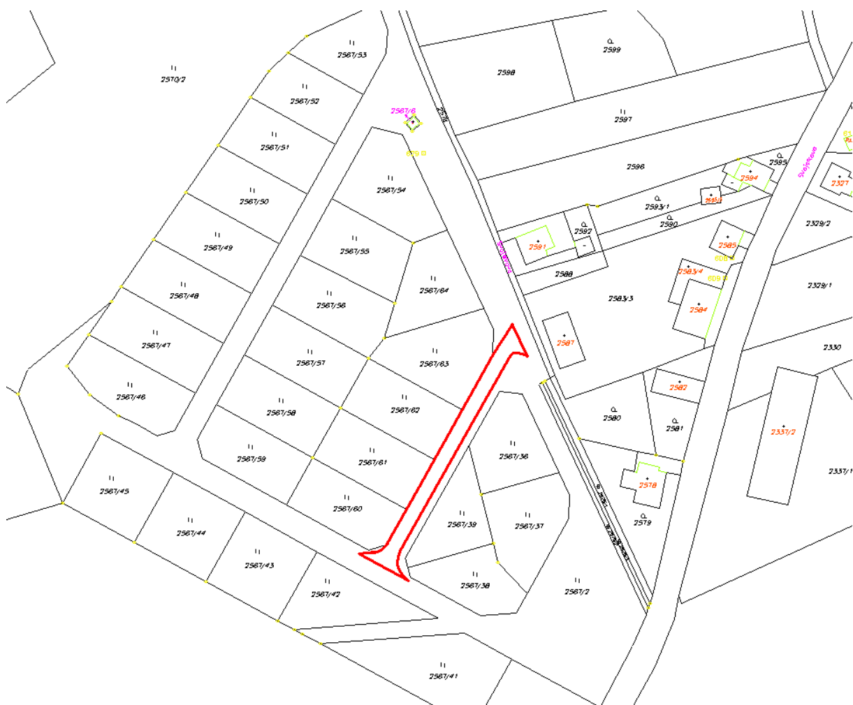
vymezení řešené části v mapě KN

Předmět zakázky bude plněn na základě uzavřené Smlouvy o dílo, přičemž dílem se rozumí stavební část stavby provedená dle projektové dokumentace zpracované ateliérem KIP, zastoupeného Ing. arch. Jiřím Kňákalem, v rozsahu dle zadání zakázky. Úplné a bezvadné provedení všech stavebních a montážních prací včetně dodávek potřebných materiálů, strojů a zařízení nezbytných pro řádné dokončení díla, dále provedení všech činností souvisejících s dodávkou stavebních a montážních prací, jejichž provedení je pro řádné dokončení díla nezbytné (např. zařízení staveniště, bezpečnostní opatření apod.).